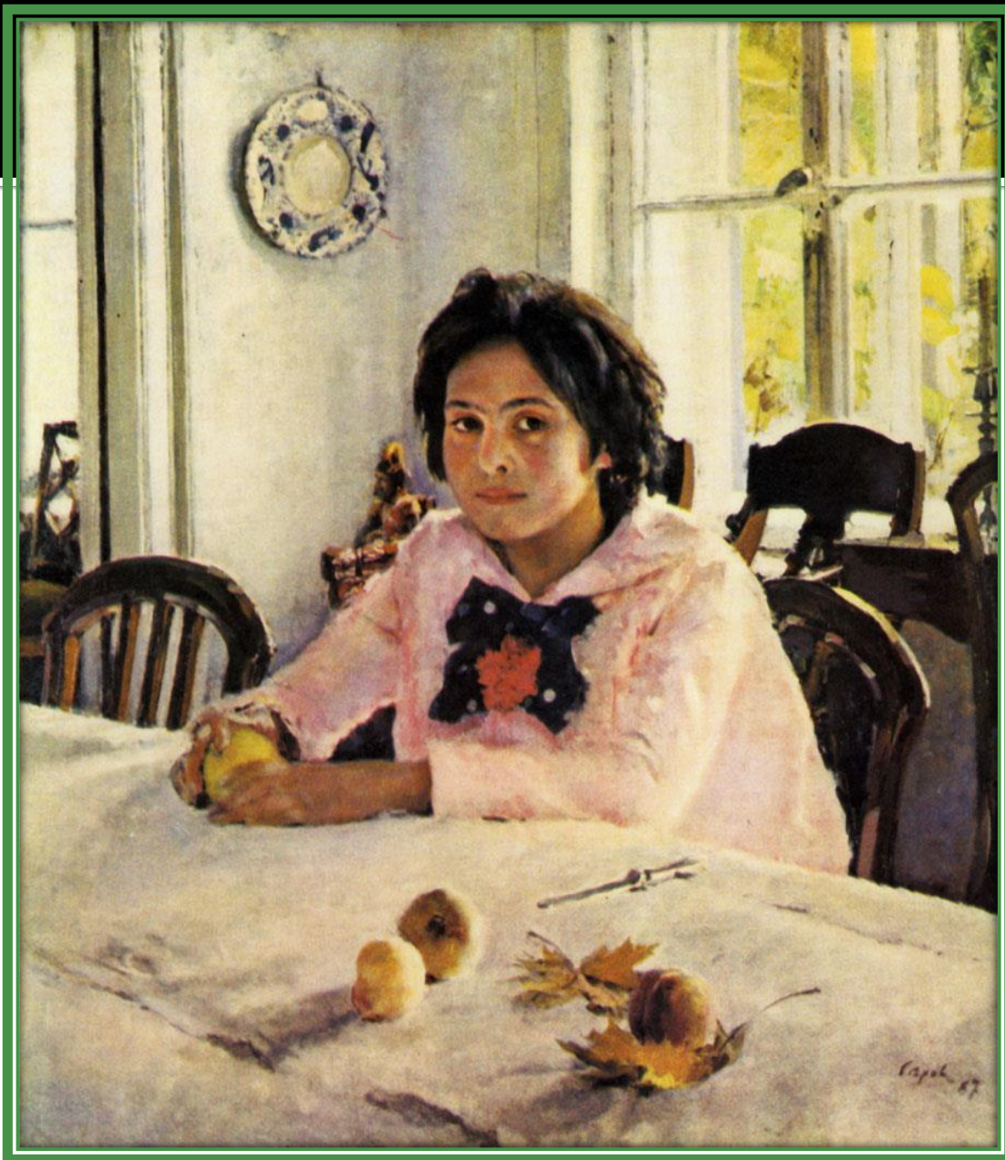
В.А. СЕРОВ «ДЕВОЧКА С ПЕРСИКАМИ»